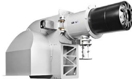
marathon® M 5001.4 ARZ - 7,7 MW

Tagungsort: Hotel Hofgut Hohenkarpfen in 78595 Hausen o.V. Beginn 14.00 Uhr, ab 18.00 Uhr gemeinsames Abendessen