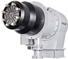
marathon® MC 10003.3 ARZsuper mit hohflamme® - 13,5 MW

dreizler® informiert Sie über aktuelle Herausforderungen in der Feuerungstechnik: Ressourcenschonung durch optimalen Einsatz der Primärenergie, NO x -, CO- oder CO 2 -Reduzierung und Minderung der Geräuschemissionen. Erfahren Sie Insider-Details über den neuesten Stand der deutschen und internationalen Verordnungen zur Schadstoffreduzierung. Für Ihre technischen Anforderungen zeigen wir Ihnen innovative und perfekt abgestimmte Lösungen: marathon® und CALORAbloc® Brennertechnik von dreizler® mit Technologien zur kontinuierlichen Verbrennungsüberwachung und Regelung sowie PC-Tools zur Berechnung von lifecycle costs. Wir unterstützen Sie mit professionellem Projektmanagement und der von uns entwickelten WebCOBRA für Ihre individuelle Brennerkonfiguration und zeigen Ihnen Möglichkeiten zur speziellen Geräuschkämmung. Profitieren Sie von der Vielseitigkeit unserer Seminare und erweitern Sie Ihr Know-how.