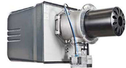
marathon® M 1001 ARZ - 1,5 MW

Tagungsort: dreizler® Werk Max-Planck-Straße 1-5 in 78549 Spaichingen Beginn: 9.00 Uhr, Ende ca. 12.00 Uhr